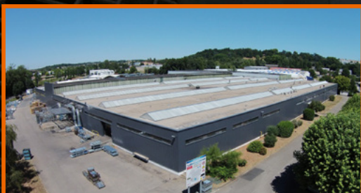
Site de production de Trévoux (01)