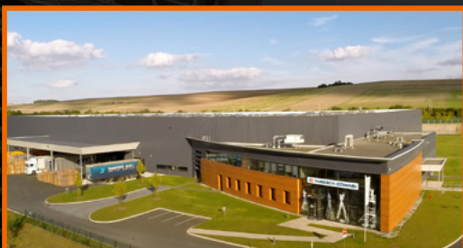
Site de production d'Ailly-sur-Noye (80)