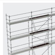
Garde-corps en version lisses