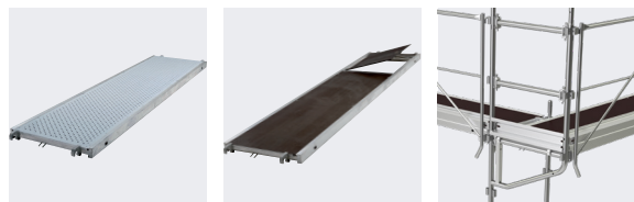
Planchers tout aluminium