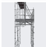
Possibilité de réaliser des passages piéton avec la poutre RC1600