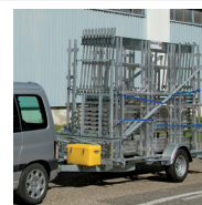
Remorque R200 pour 88 m 2 de R200 PROGRESS 1,3 tonne (permis B)