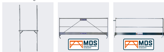
Cadre en H R3